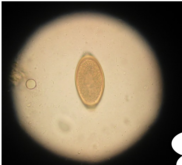
Huevo de lombriz visto por microscopio