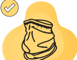
Khăn giữ ấm