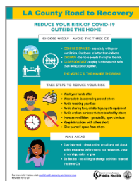
현명한 선택 - 집 밖에서 COVID-19의 위험 감소