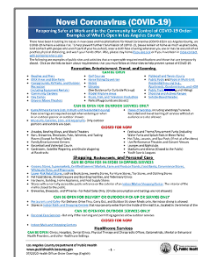
로스앤젤레스 카운티에서 운영하는 업종