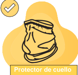
Protector de cuello