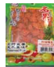
Sanh Yuan Preserved Plum de Taiwan Retirado: 10/16/12