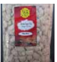
Rewari Sugar-Flat Candy Retirado: 2/23/12