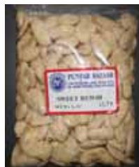
Sweet Rewdi Retirado: 11/17/11