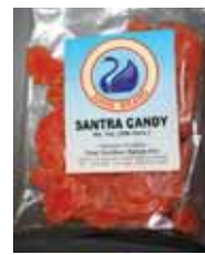
Hans una marca de India Santra Candy Retirado: 3/24/11