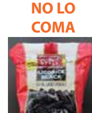
NO LO COMA Aussie-Style Lucky Country Soft Licorice 'Traditional Black' 98% Fat Free 5