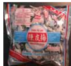
Chan Pui Mui Preserved Plum de Hong Kong Retirado: 10/16/12