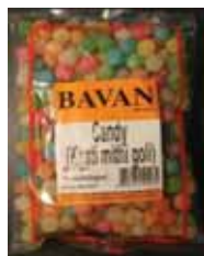
Khati Mithi Goli Retirado: 1/28/11