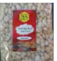
Rewari Sugar-Round Candy Retirado: 2/23/12