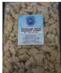
Punjab Bazaar de India Rewari Gur Jaggery Retirado: 11/17/11