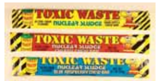
"Toxic Waste" brand "Nuclear Sludge Bar" (Sabores diferentes) 3 de Pakistán Retirado: 1/14/11

Ultima Fecha de Actualización: 7 de abril 2016 2