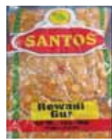
Rewari Gur Retirado: 10/7/13