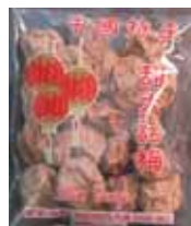
Red Lantern Plum Candy de China Retirado: 10/16/12