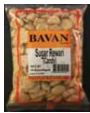
Sugar Rewari Retirado: 6/30/11