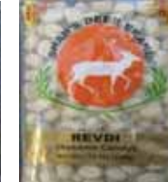
Revdi (Sesame Candy) Retirado: 3/5/12