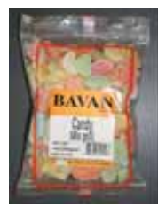
Mix Goli Retirado: 12/1/11