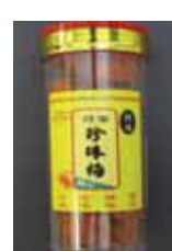
Preserved Plum de China Retirado: 11/5/12