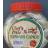
Chef's Pride Rewadi Candy de Pakistán Retirado: 3/5/12