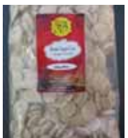
Rewari Sugar-Coin Candy Retirado: 2/23/12