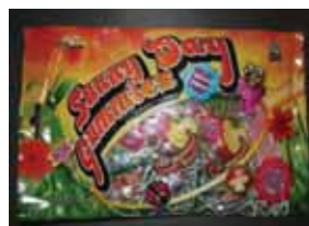
Bee Brand Sunny Day Gummies Retirado: 12/1/11