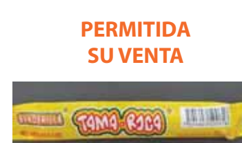
PERMITIDA SU VENTA Tama Roca Banderilla 6 Se permite la venta del lote con código 13YYMMDD. No coma dulces con código antes 13YYMMDD.