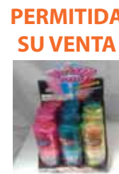
PERMITIDA SU VENTA