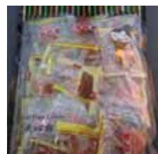
Gold Plum Candy de Taiwan Retirado: 7/20/12