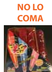
NO LO COMA Flash Pop Candy by Kidsmania 4