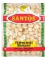
Santos Dulces de India Rewari Sugar Retirado: 9/13/13