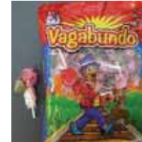
Vagabundo Paletas de Mexico Retirado: 3/30/12