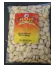
Sugar Rewari Retirado: 11/17/11