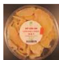
Ginger Candy de Vietnam Retirado: 8/5/13