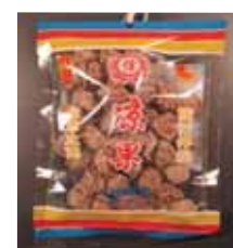
Dried Plum de Hong Kong Retirado: 11/5/12