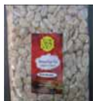
Rewari Gur-Flat (Jaggery Candy) Retirado: 2/16/12