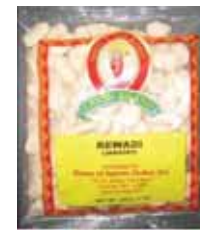
Laxmi Brand Rewadi (Jaggery) de India Retirado: 2/16/12