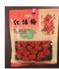
Dried Red Prune de Taiwan Retirado: 11/5/12