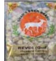
Shah's Deer una marca de India Revdi (Gud) (Sesame Candy) Retirado: 3/5/12