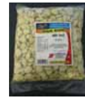
Jyoti Indian Sweets Bonbons Indiens Sugar Rewdi Retirado: 11/17/11