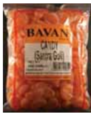
Santra Goli Retirado: 1/28/11