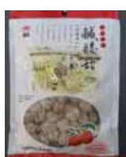
Ching Ling Dried Prune de Taiwan Retirado: 11/5/12