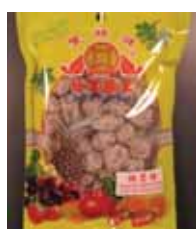
Sweet & Soure Prune de Taiwan Retirado: 11/5/12