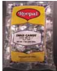
Roopal Swad Candy de India Retirado: 11/18/11