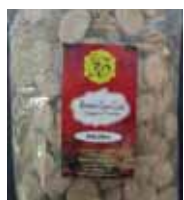
Rewari Gur-Coin (Jaggery Candy) Retirado: 2/23/12