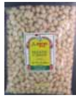
Sesame Candies Retirado: 10/7/13