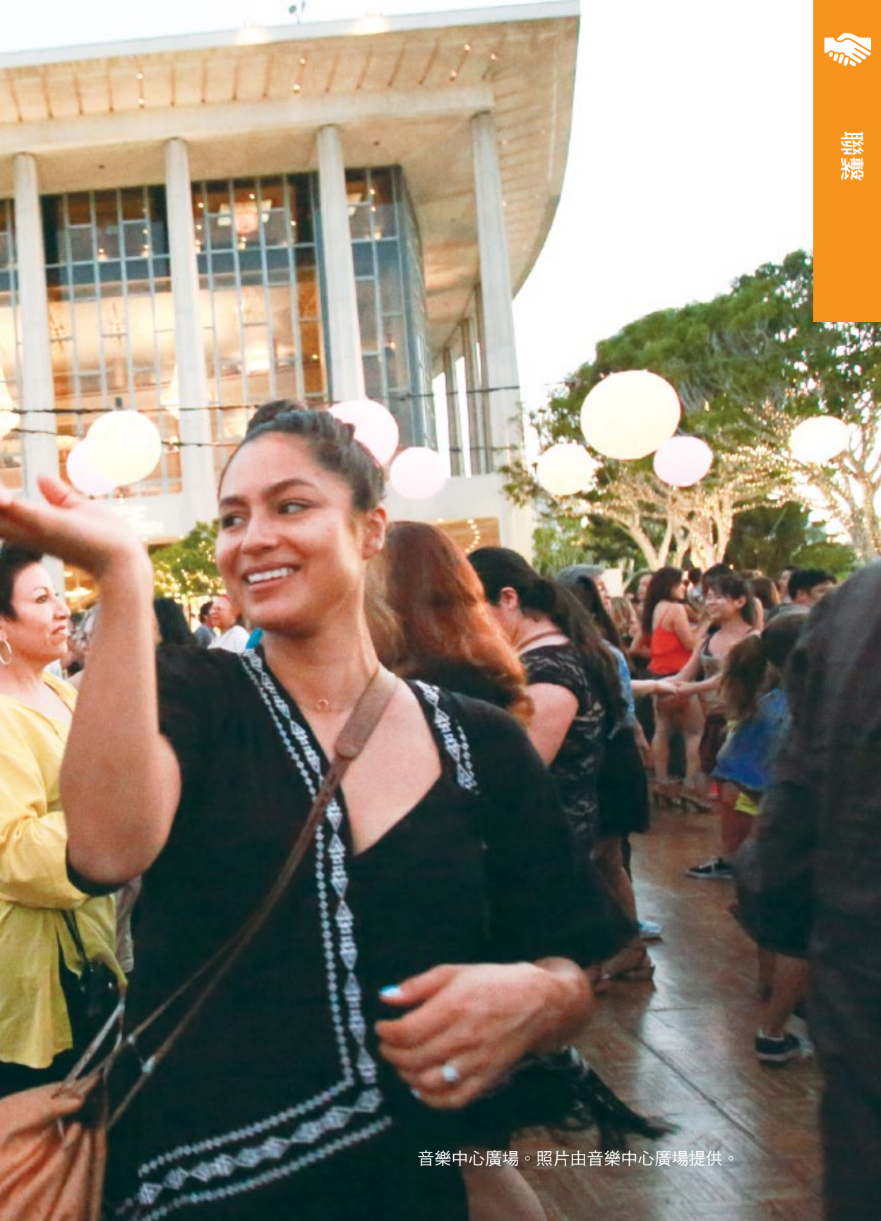
音樂中心廣場。