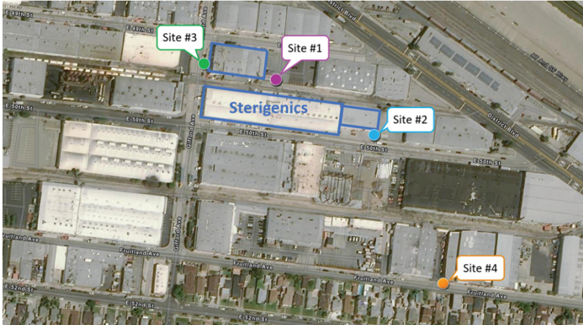
Figure 3. Map of 24-hour sampling locations.